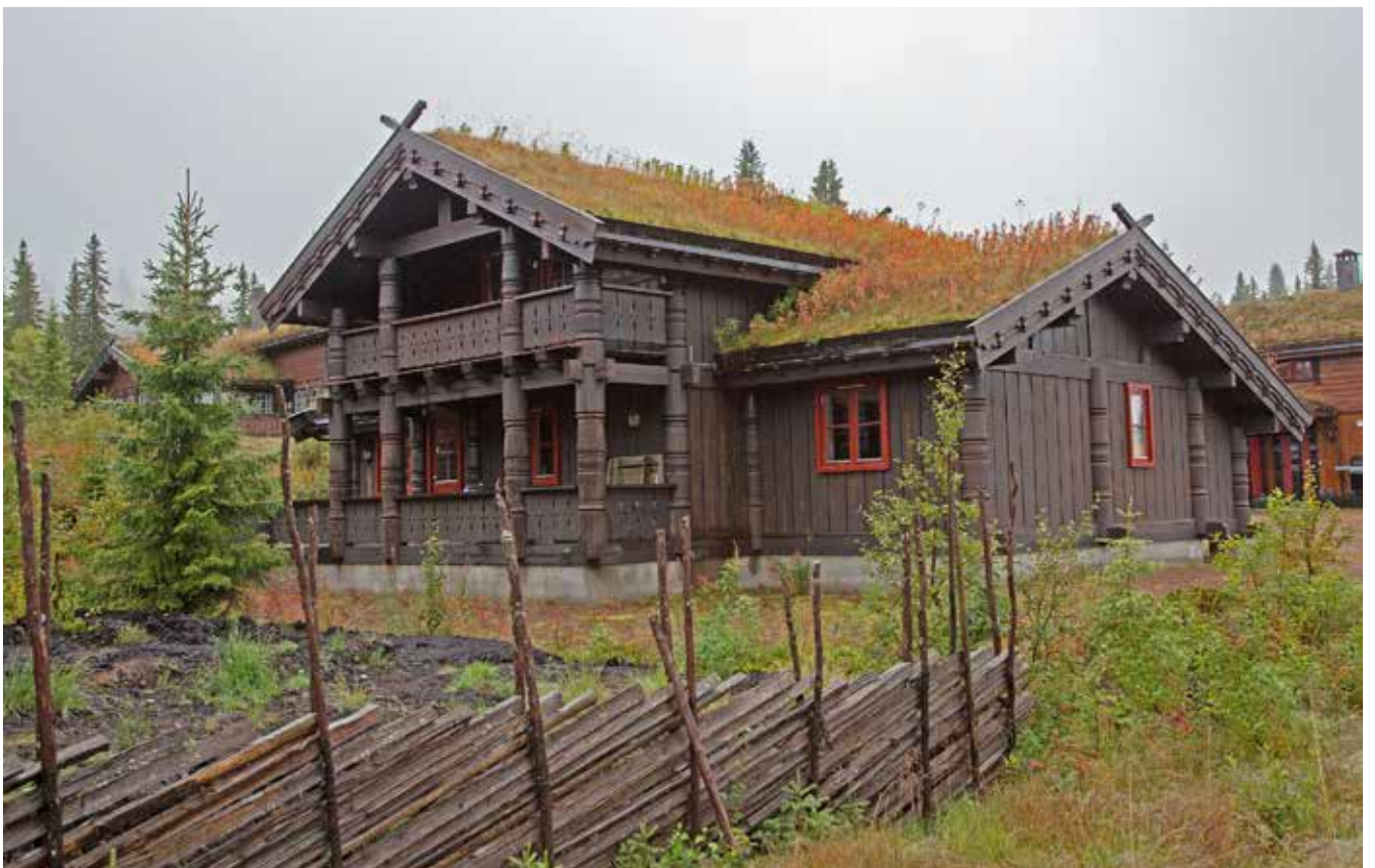
Byggnaden hålls samman på grund av nyttjandet av grovt stående eller liggande trä och en sammanhållen färgsättning. En stor lekfullhet i utformning av stolpar, vindskivor och räcken gör byggnaden helt unik. Gavelfasaden delas upp genom stolpverk och bärande konstruktion. Foto från Trysil.