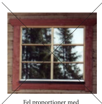
Fel proportioner med liggande rutor