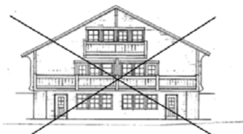
Breda gavlar blir oftast alltför dominerande

En stor byggnad som brutits ner i flera mindre volymer. Foto från Trysil.