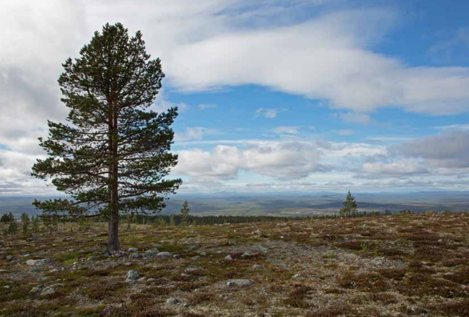
På Idre Himmelfjäll finns allt från kalvfjäll till trollskog