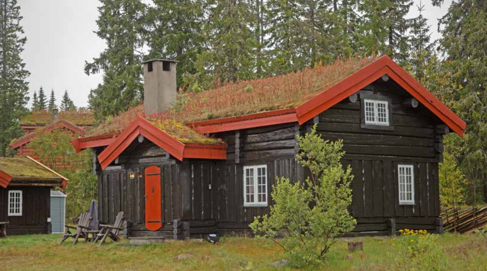
Även till mindre byggnader kan trä användas på flera olika sätt. Okantad panel, timmer, symmetrisk fönstersättning och aldrig ett spetsigt fönster. Foto från Trysil.