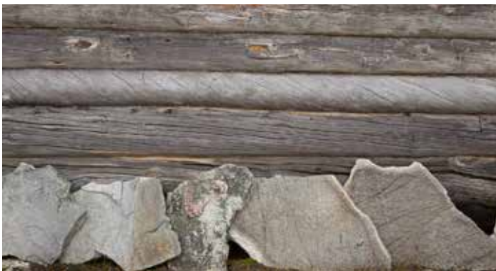
Rundtimmer och natursten