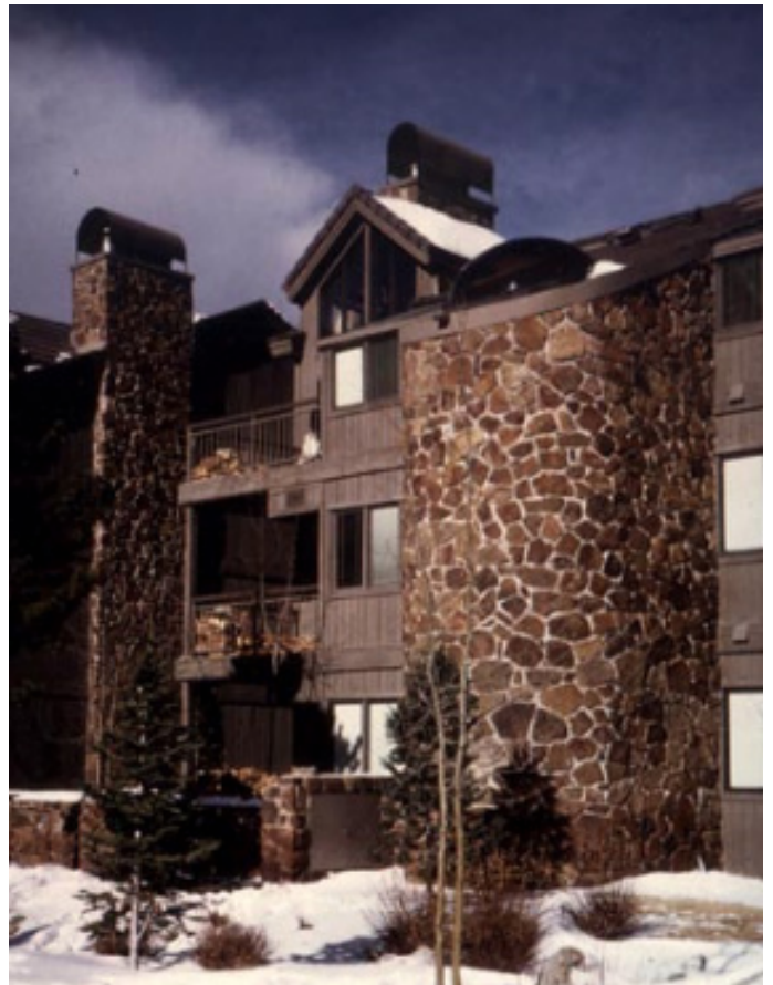
Lägenhetshus från Vail med naturstensmur