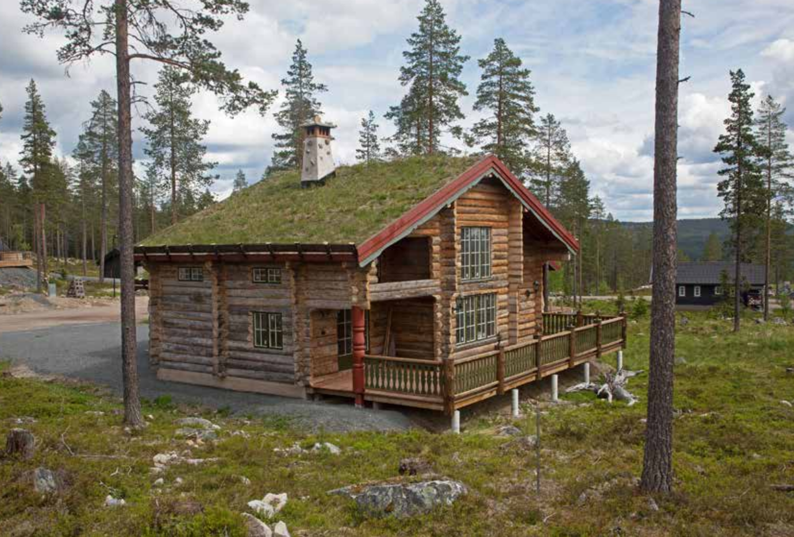
Hus på Idre Himmelfjäll