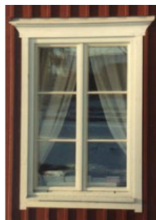
Fina proportioner med profilerat överstycke