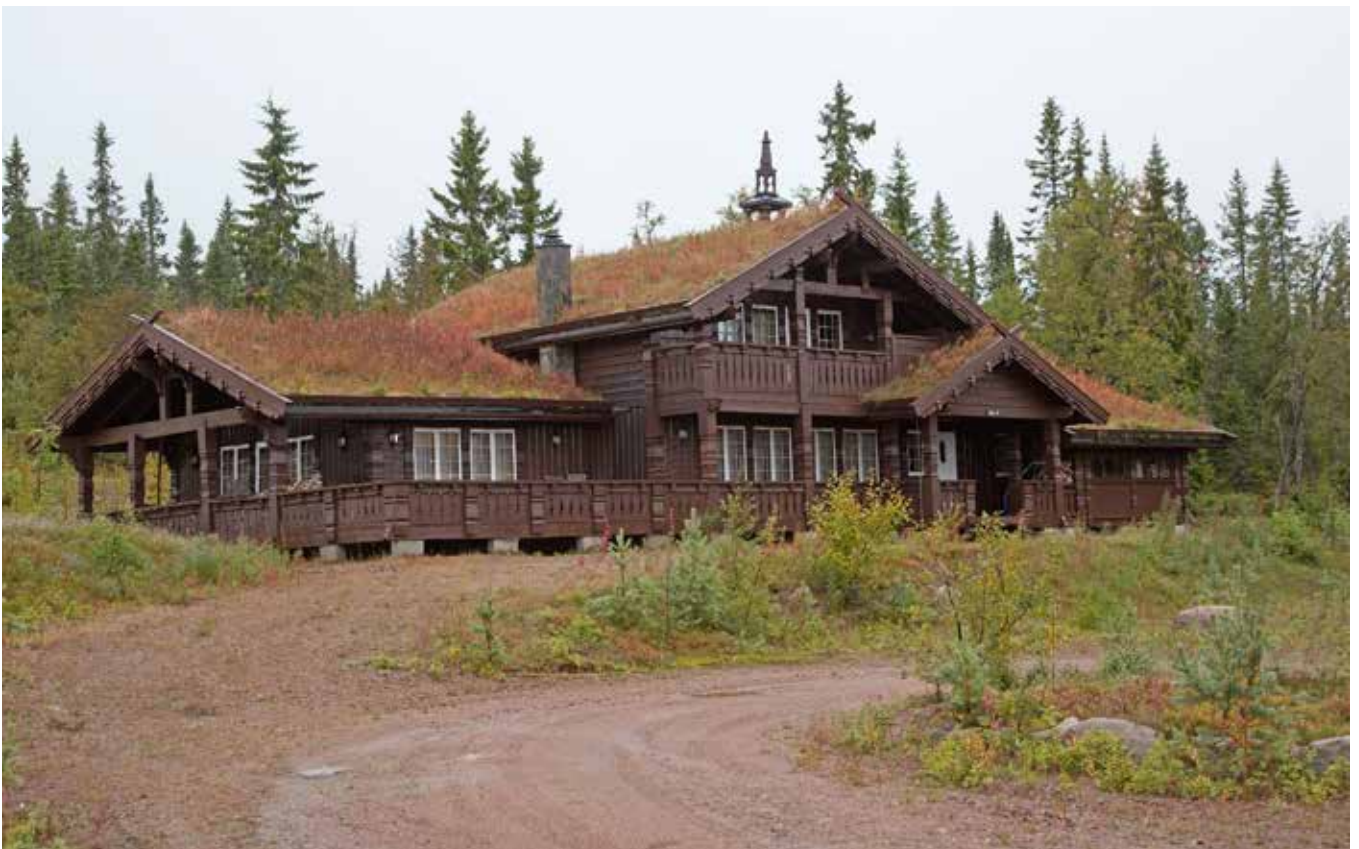
Lekfull användning av timmer och uppdelning i flera volymer som adderats. Genomarbetat stolpverk med pelare och balkar som är skulpterade. Foto från Trysil.