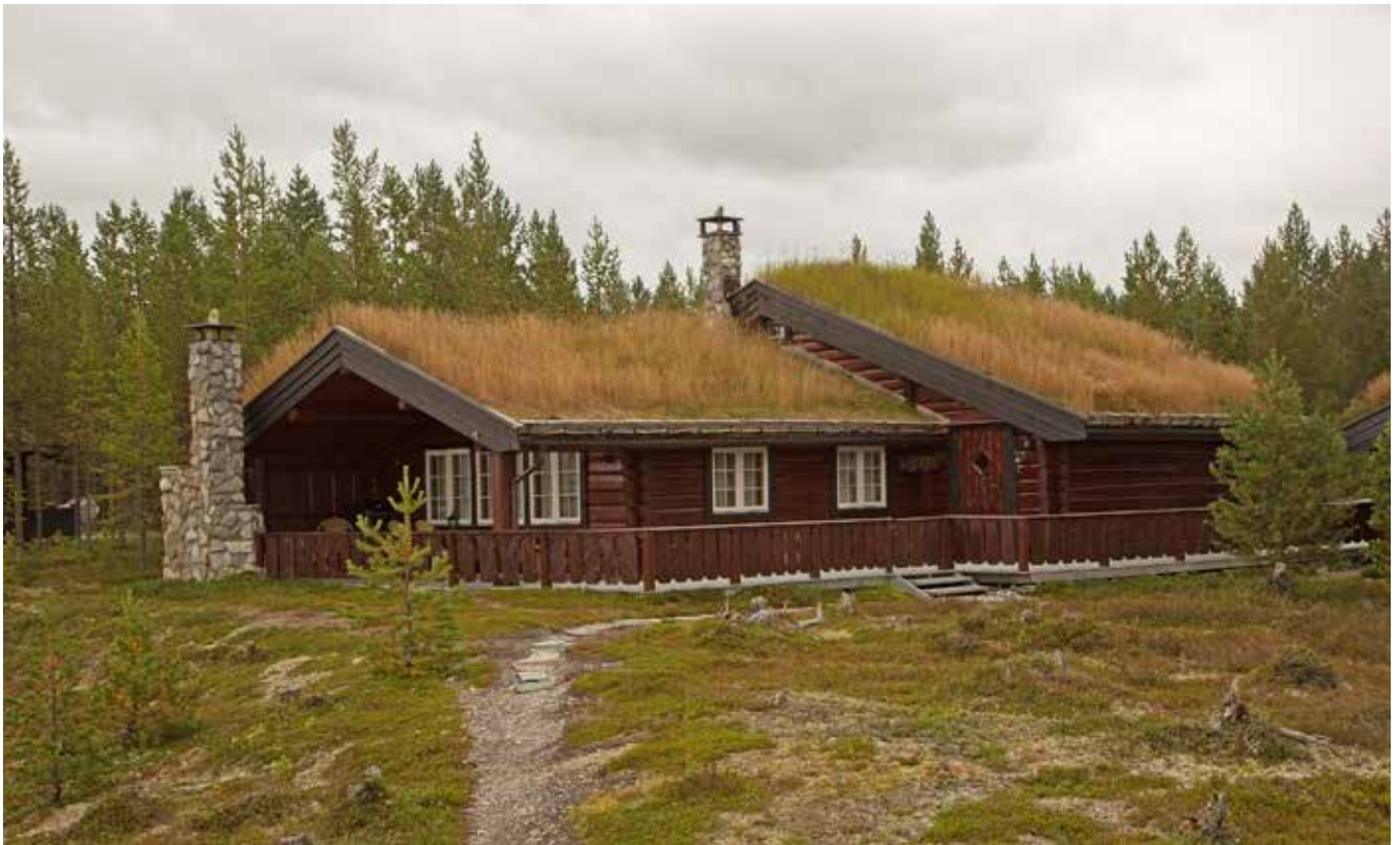
Även natursten och trä fungerar utmärkt tillsammans. Fönstersättningen är symmetrisk och enkel. Användningen av trä varieras men hålls ändå samman. Foto från Elgå.