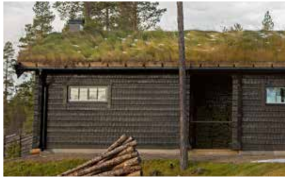
Planktimmer i kombination med torvtak