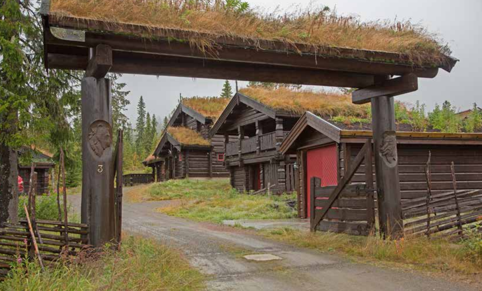
Även entrén till en sammanhållen gårdsmiljö i Trysil tar upp byggnadernas uttryck. Trots stora byggnader upplevs naturen nästan orörd. Stolparna har skulpterade reliefer av rovdjur. Foto från Trysil.