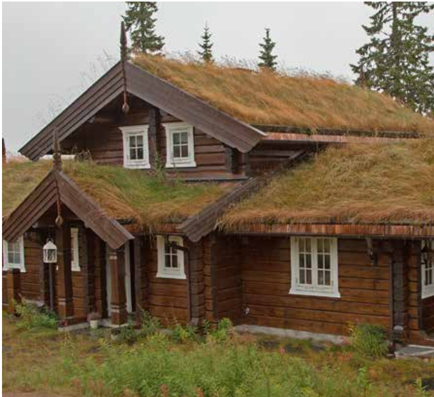
Bra proportioner på fönster med glasytor på högkant. Foto från Trysil.

Fönsteromfattningar skall vara enkla och inte förses med alltför breda foder. Foder skall inte överdrivas så att de uppfattas som "tårtapper".