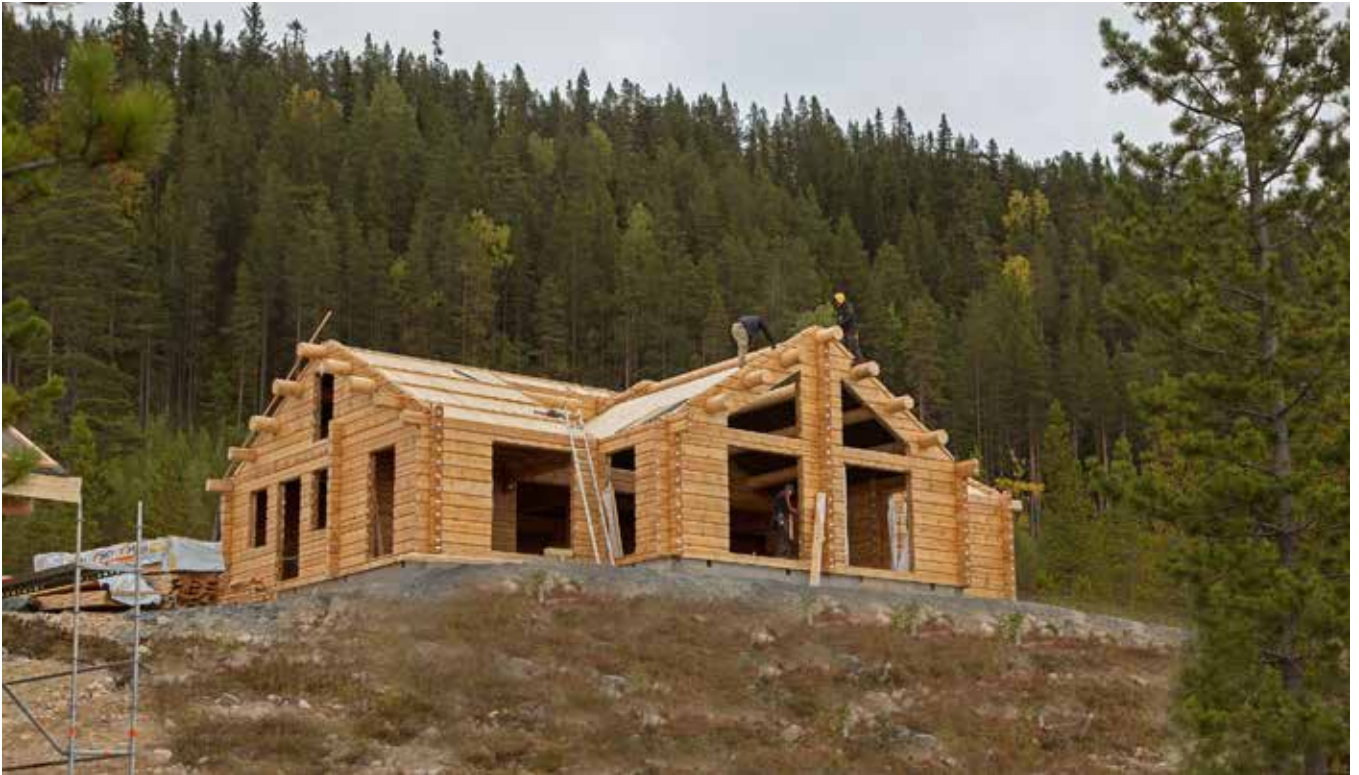
En ny profilstark byggnad växer fram på Himmelfjäll