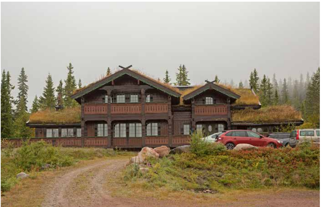
Stora byggnader delas upp i flera volymer och ger ett spännande uttryck. Användandet av grovt trä varieras i stående och liggande. Fönstersättningen symmetrisk och uppdelad med spröjsade rektangulära fönster med glasytor på högkant. Foto från Trysil.