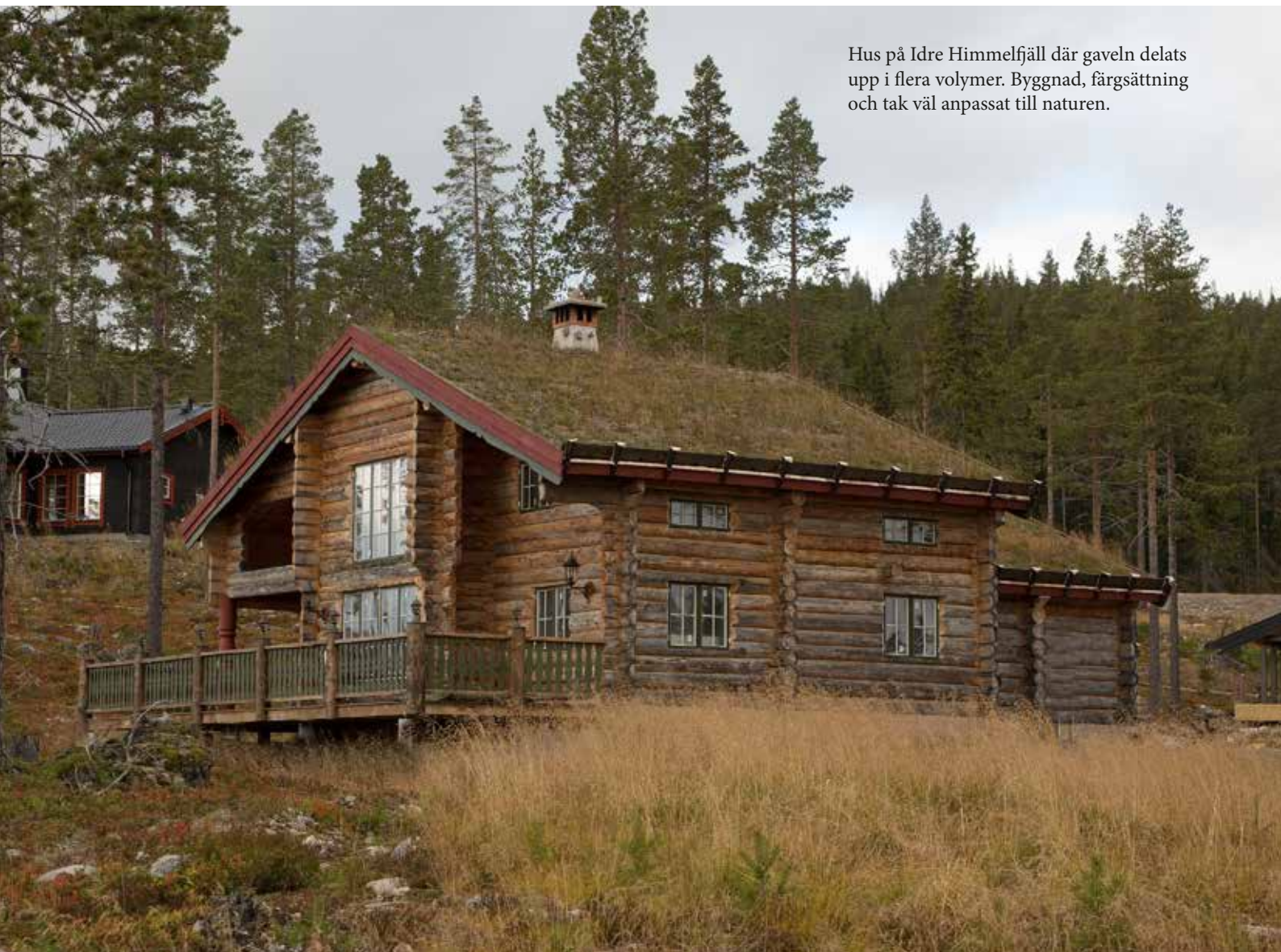
Hus på Idre Himmelfjäll där gaveln delats upp i flera volymer. Byggnad, färgsättning och tak väl anpassat till naturen.