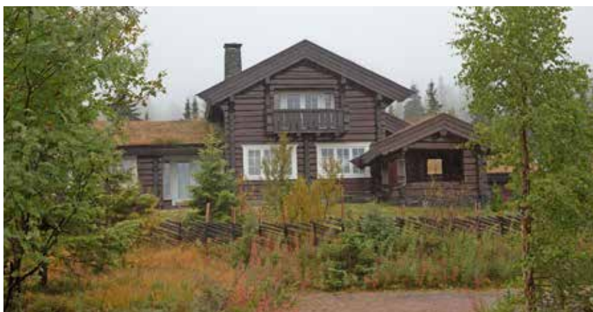
Rätt utformade och färgsatta blir husen en del av naturen. Naturen har behandlats mycket varsamt, och området får en stark profil. Foto från Trysil.