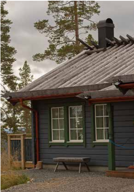
Överst till vänster; tegeltak, nedst till vänster; trätak med kluvor, till höger; torvtak.