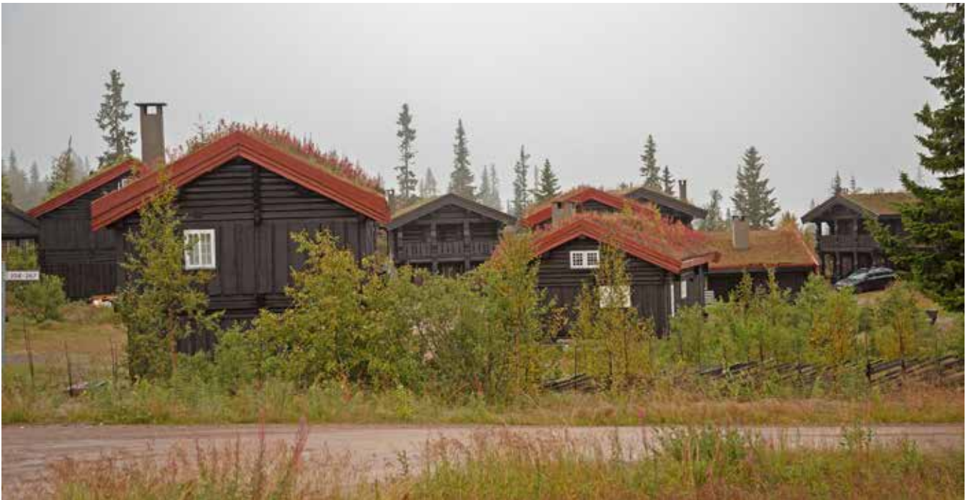
Stor variation på byggnaderna men ändå ett sammanhållet område genom enhetliga taklutningar, sammanhållen färgsättning och träfasader. Foto från Trysil.