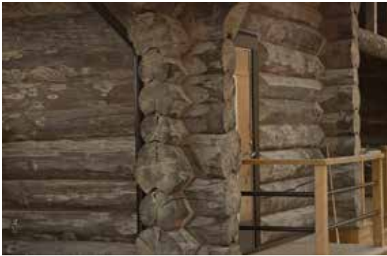
Rundtimmer ger ett robust och genuint intryck