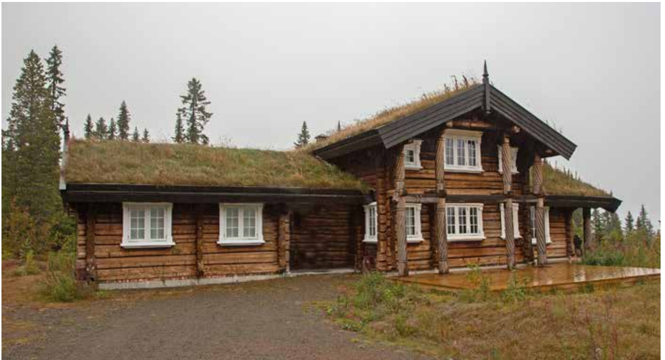
Ren symmetrisk fönstersättning och lekfullt utformad gavel. Foto från Trysil.