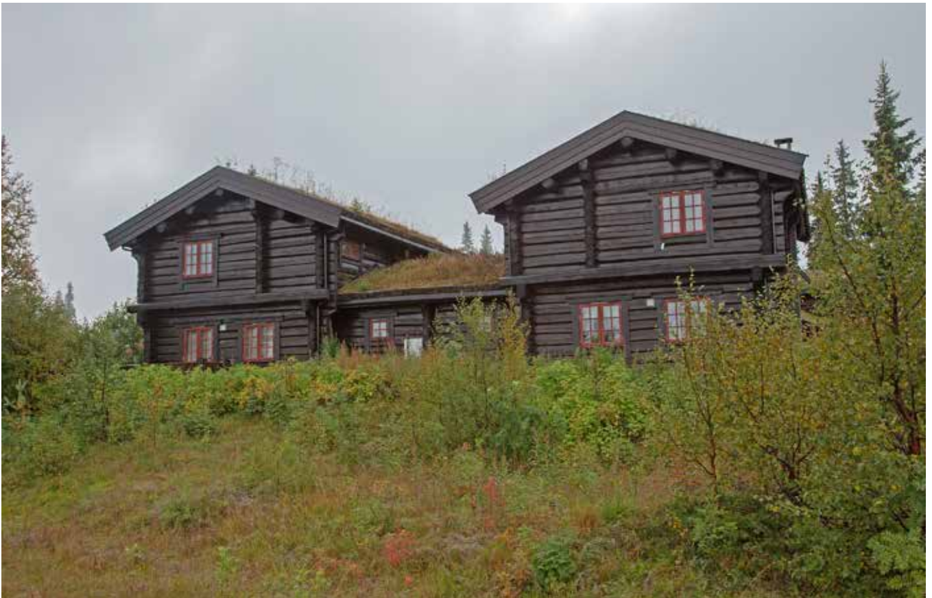
Utkragad övervåning ger ett småskaligt intryck trots en stor byggnad. Symmetrisk fönstersättning. Foto från Trysil.