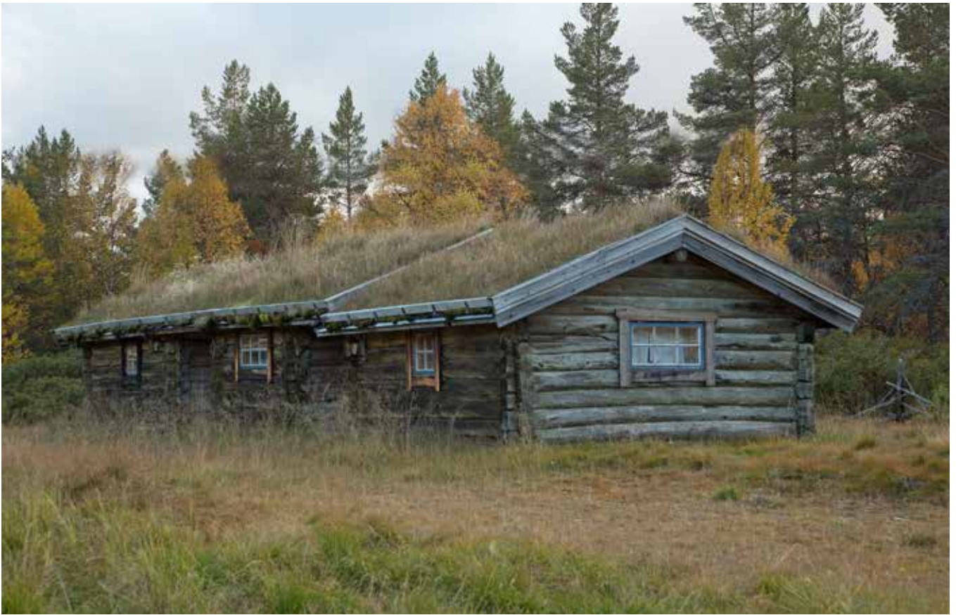
Traditionell timmerbyggnad på Idrefäboden Grunddagssättern. Timmer av olika dimensioner har använts som ger en varierad fasad.