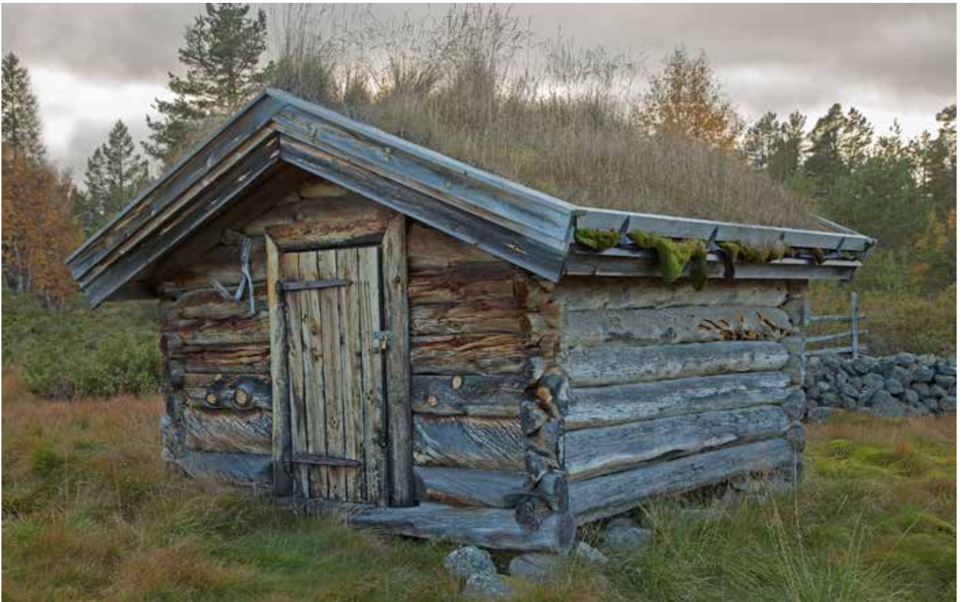
Förrådsbyggnad på Grunddagssätterns fåbod delvis timrad av torrvara.