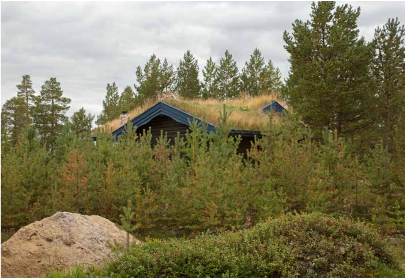
Husen kan blir en del av naturen.