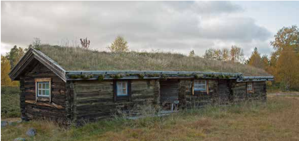
Traditionell fäbodbyggnad från Grunddagssäterns fäbod i Idre

måste uppföras med sten- eller putsad fasad och innehålla sparsamt med inslag av trä. Därför bör man sträva efter att inte bygga högre hus än två, möjligen tre våningar. Trots dagens krav skall traditionell kunskap om hur trä används ligga till grund för utformningen av byggnaderna.