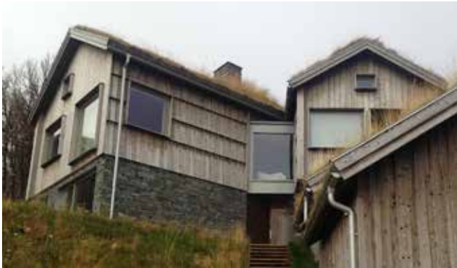
Naturstensgrund kan med fördel kombineras med träfasader