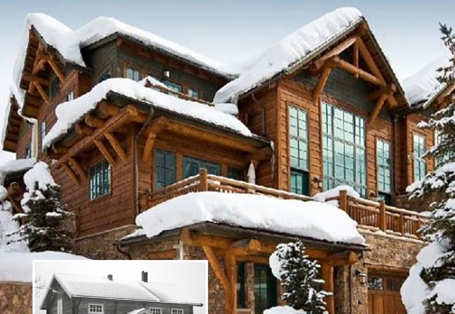
Vail i USA