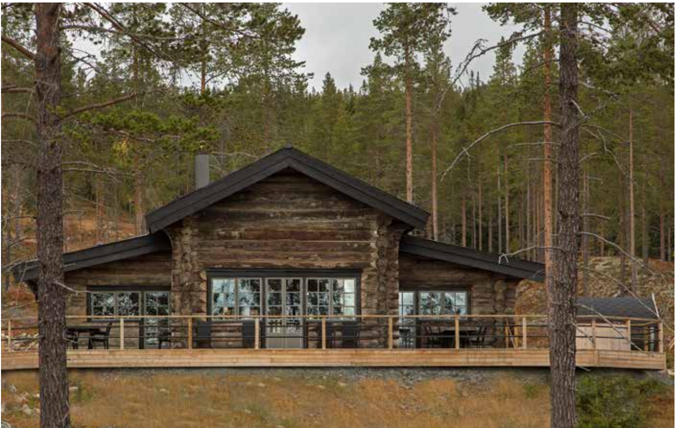
Byggnad i rundtimmer på Himmelfjäll