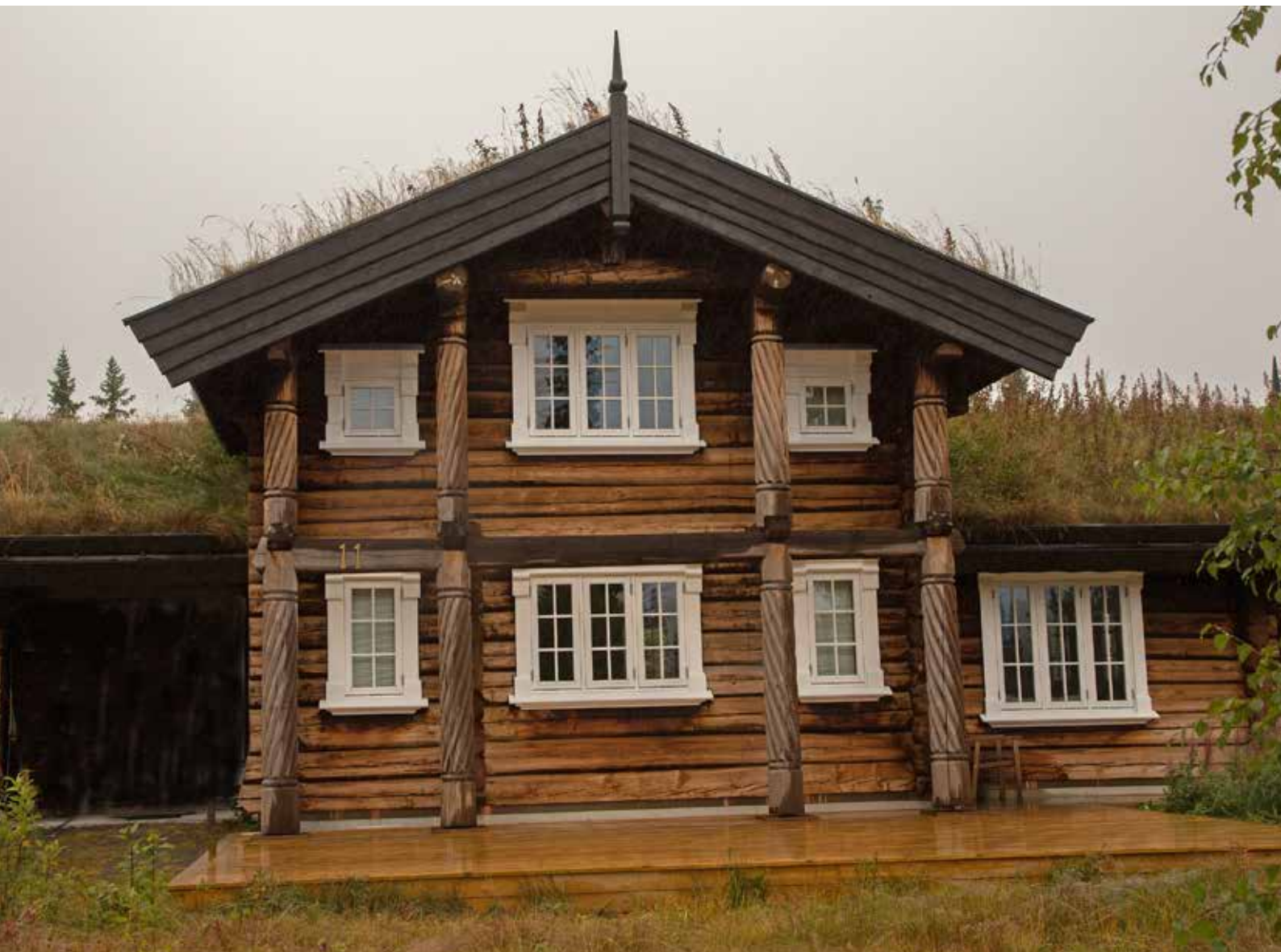
Breda vindskivor ger tyngd åt torvtaket. Stolpverket är genomarbetat med skulpterade stolpar som ger profil. Foto från Trysil.