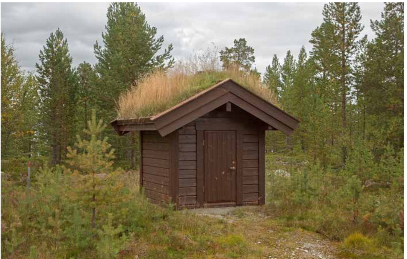
Även teknikbyggnader kan anpassas och bli en del av naturen.