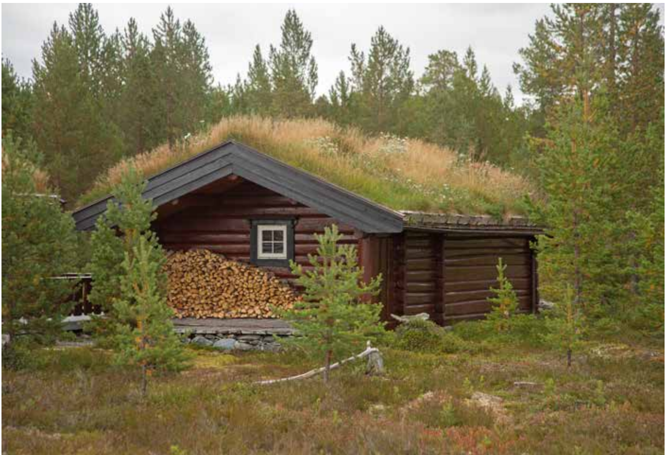
Kraftiga vindskivor förstärker det robusta i byggnaden och gör att torvtaket vilar på byggnaden. Foto från Elgå.