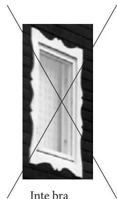
Inte bra utformning