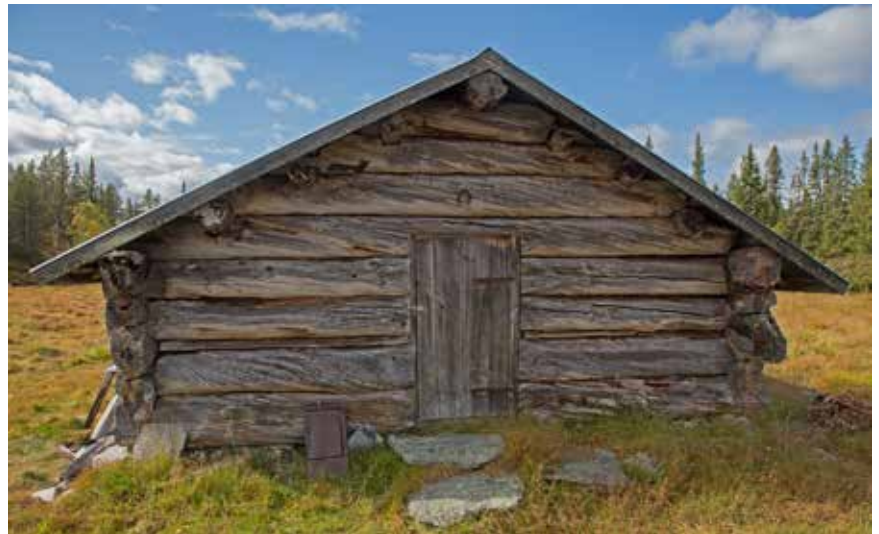
Rundtimmerbyggnad vid Gjotens säter i Grövelsjön