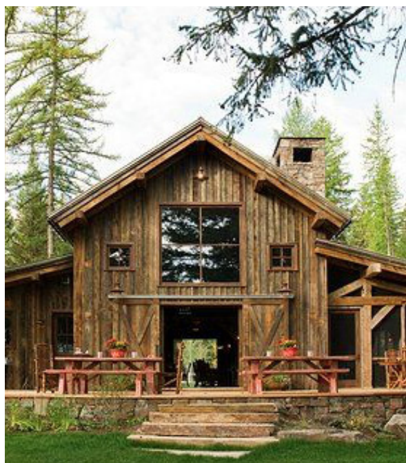
Vail i USA