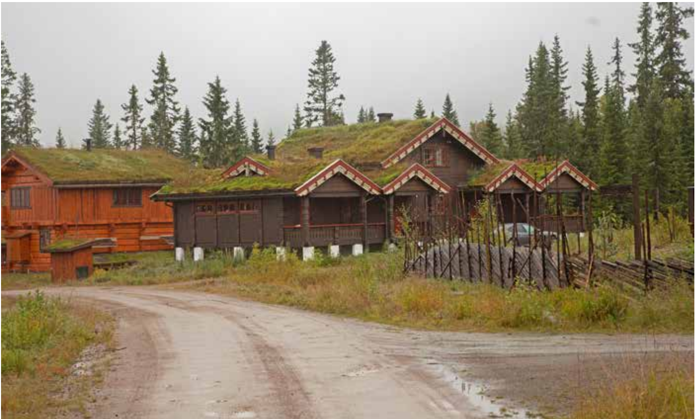
Uppdelning av fasader i sektioner. Lekfull formgivning och färgsättning av vindskyven. Foto från Trysil.