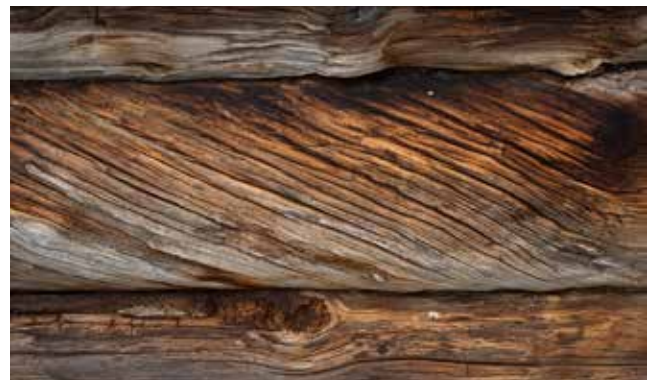
Torrfulor i byggnad vid Gjotens säter