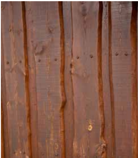
Okantad panel ger liv åt fasaden