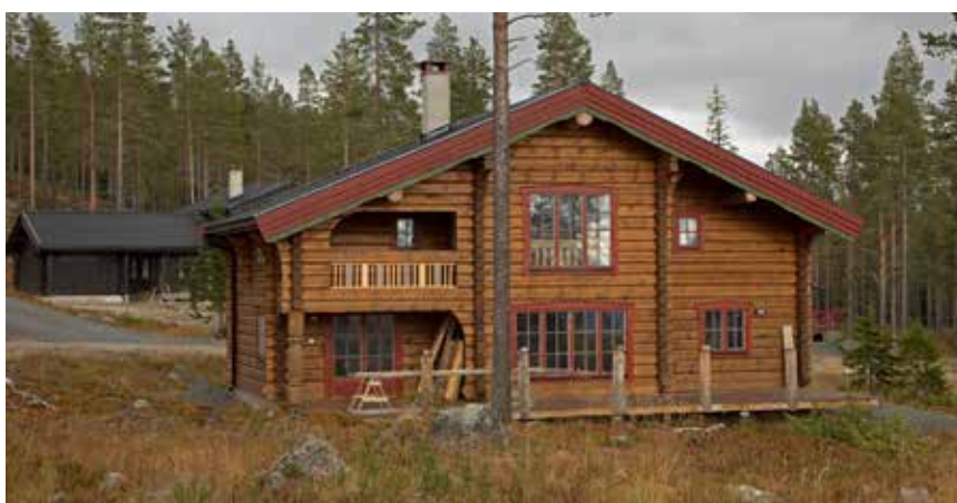
Hus på Idre Himmelfjäll.

Byggnader i norra Dalarna och fjällvärlden hade ett primärt syfte att skydda mot vindar och oväder och var därför relativt slutna. Det traditionella materialet är trä, timmer och stående grov lockpanel. Timmerfasader skall vara enkla och raka i sin utformning och inte förses med svängda knutar, spetsiga fönster och utsirade taktassar. Natursten kan användas som ett komplement till träfasader. Färgsättningen skall vara dämpad och utgöras av vitriol, lasyrer, slamfärger eller linoljefärger i mörka matta grå, bruna och svarta toner. Blanka färger och rött accepteras inte. Kravet på dämpad färgsättning regleras även i detaljplanerna.