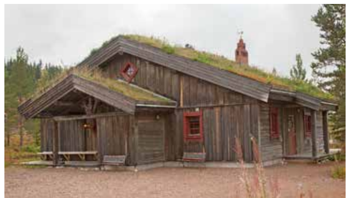
Även mindre hus i panel och timmer passar på delar av Himmelfjäll